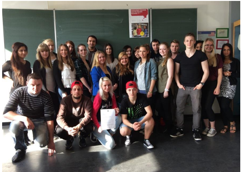
Glückliche Gewinner, die Klasse BS1A des GSBK

Geschwister-Scholl-Berufskolleg Städt. Schule für Technik, Hauswirtschaft und Sozialpädagogik - Sekundarstufe II -