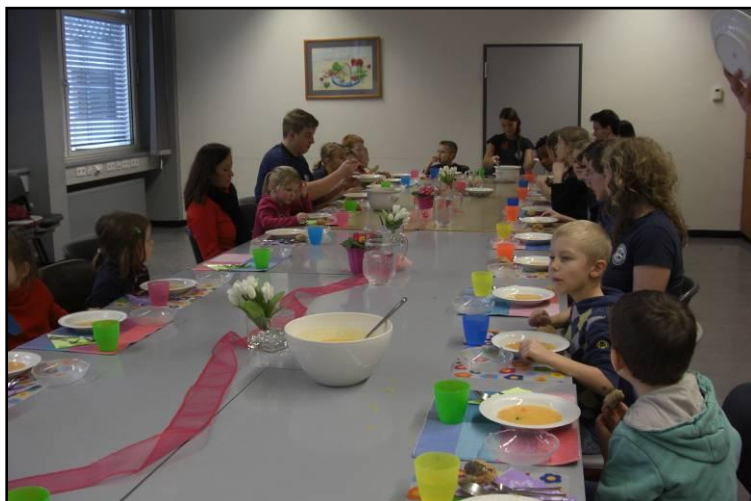
An der reich gedeckten Tafel wird das gesunde Essen genossen

Geschwister-Scholl-Schule Städt. Berufskolleg für Technik, Hauswirtschaft und Sozialpädagogik - Sekundarstufe II -