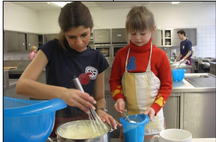
Schülerin der BH 2 mit einem kleinen Kochtalent