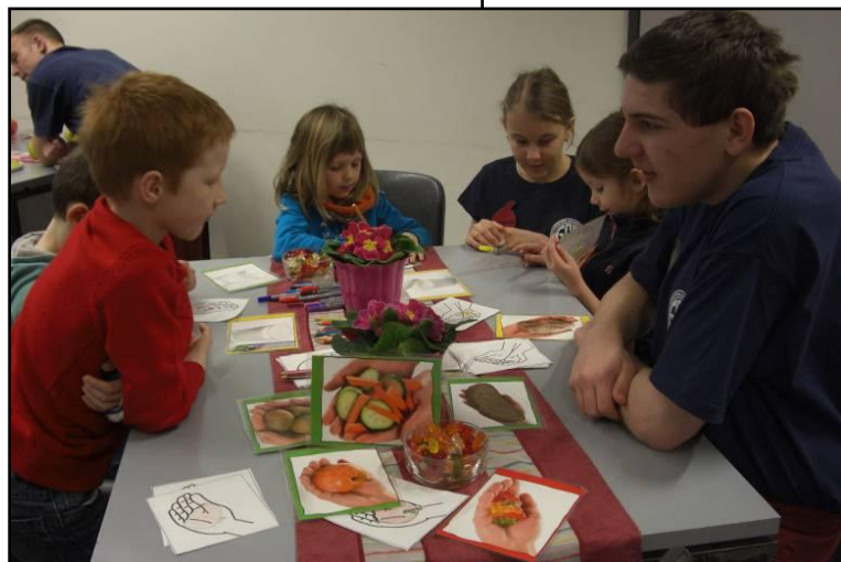
Gesunde Ernährung spielerisch erklärt

Mit der Temperatur der Kochtöpfe stieg ebenso die Vorfreude auf die spätere gemeinsame Verkostung. Bereits nach kurzer Zeit füllte ein süßlicher Duft den Raum. Die vielen funkelnden Augen und strahlenden Gesichter ließen schon früh ahnen, dass der Tag ein voller Erfolg werden würde. Nachdem Möhrensuppe,