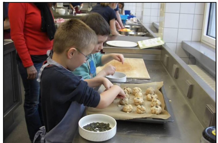
Liebevolle Zubereitung von Vollkornbrötchen