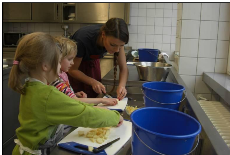
Schülerin der BH 2 bei der gemeinsamen Zubereitung von Apfelkompott

Hauswirtschaft und Sozialpädagogik - Sekundarstufe II -