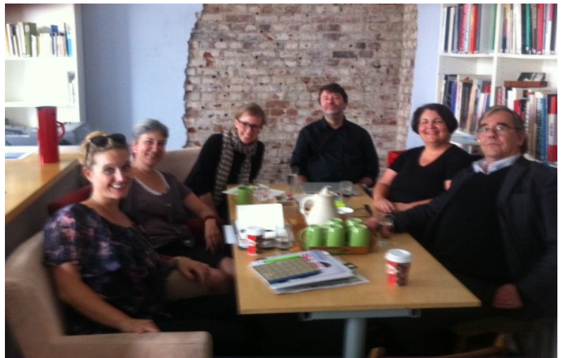
Geschwister-Scholl-Berufskolleg und ecosign Universität im Austausch

Geschwister-Scholl-Berufskolleg Städtische Schule für Technik, Hauswirtschaft und Sozialpädagogik - Sekundarstufe II -