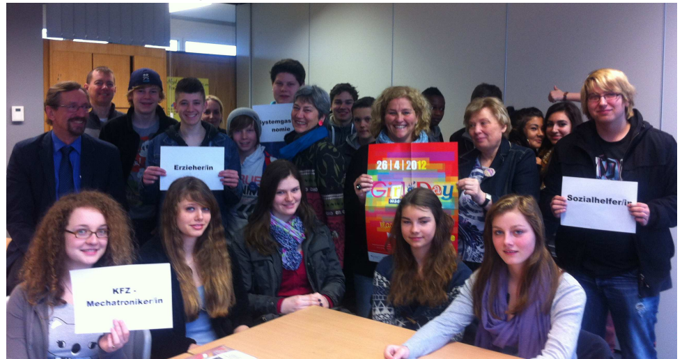
Organisatoren und Teilnehmer des Girls und Boys Day 2012

Nun, zum einen haben sich die Lebensmodelle von Männern und Frauen geändert, Männer sind nicht länger auf die Alleinernährerrolle festgelegt, meist arbeiten beide Partner, auch wenn sie eine Familie gegründet haben, in ihrem Beruf weiter. Zum anderen wird die Eignung für einen Beruf nicht durch das Geschlecht oder den kulturellen Hintergrund bestimmt, sondern durch das Interesse und das Talent eines Menschen. Ihr werdet später merken, dass wir viel Zeit unseres Lebens mit Arbeiten